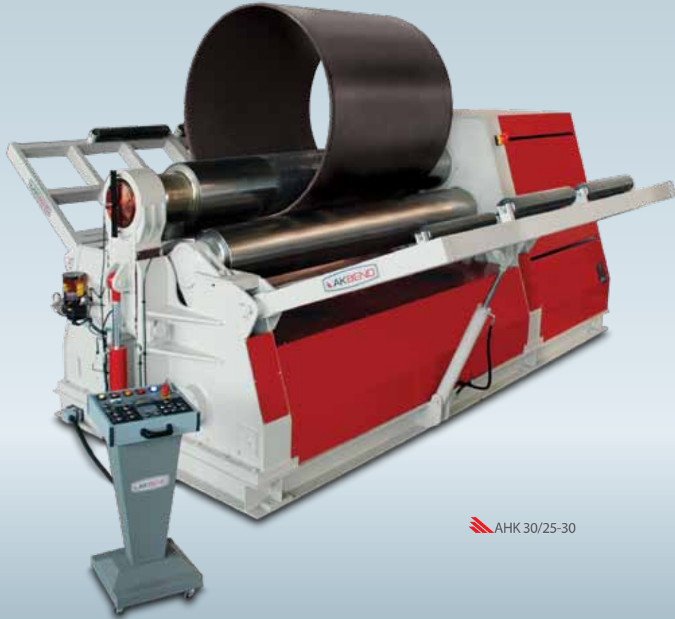
AKBEND AHK 30/25-30